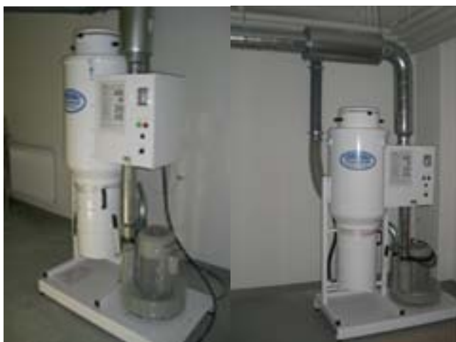
ECE försedd med halvmanuell filterrensning och frekvenstyrning