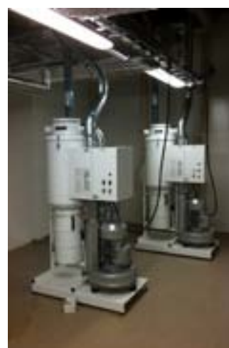
Dubbla ECE-13 kW utrustade med automatisk filterrensning och frekvenstyrning