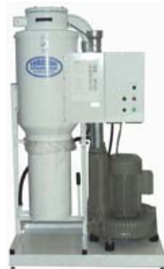
ECE försedd med automatisk filterrensning och frekvenstyrning

Enheterna kan vid förfrågan levereras med bullerhus för fläkten.